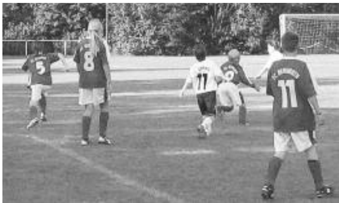
„Größen“ beim Mädchen-Fußball