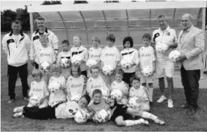
Neue Fußballbälle für die F-Junioren überreicht von der EON