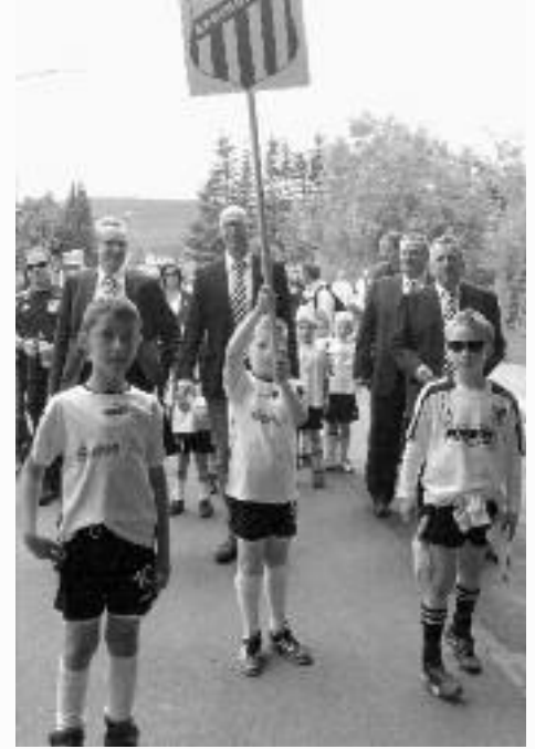
Kein Schützenfest ohne den FC!!