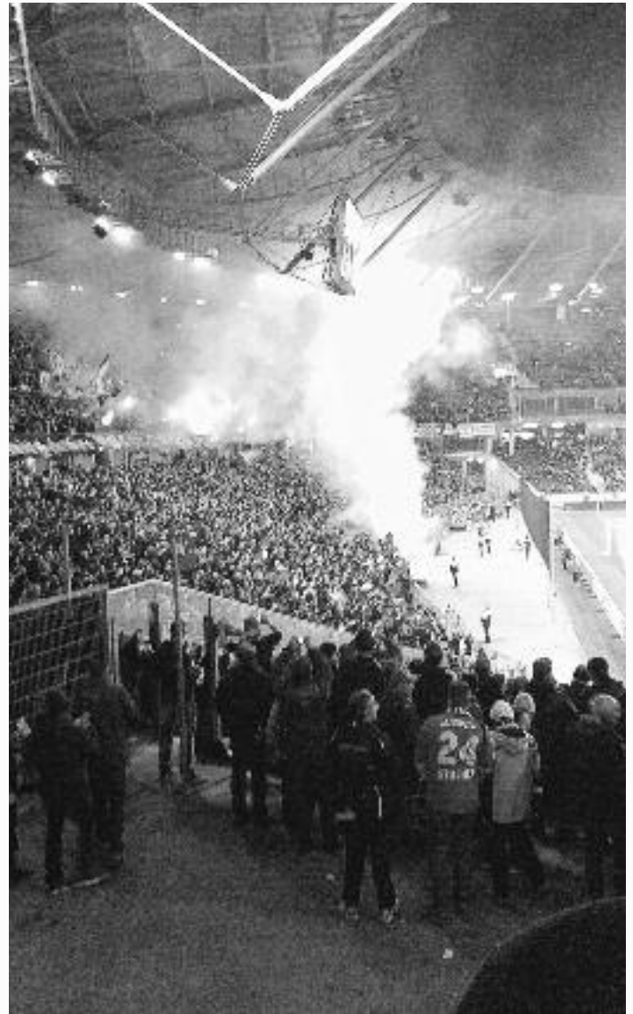
Pyrotechnik. Nur Spaß oder Gefahr oder gutes Recht der Fans?

Weiteres Highlight: Das Fußballmuseum ist Tour Ort am Regionsentdeckertag 8. September für die Stadt Springe mit Aktivitäten für die Kinder, Quiz und Preisen und dem Fanmobil von 96.