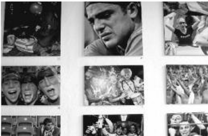
Die ganze Welt der Emotionen und des Fanverhaltens soll dargestellt werden.

www.A-Z-Mietservice.de Verkauf - Vermietung - Service