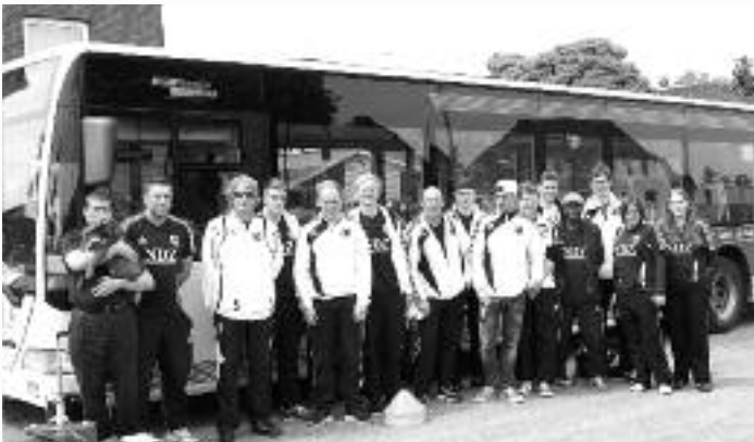
Die Erste fühlte sich bei langen Auswärtsfahrten im Bus des RVH sehr wohl und hofft auch in der kommenden Saison auf diese kommunikative Möglichkeit