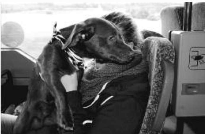
Mannschaftsmaskottchen Milow war dabei!