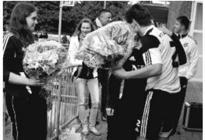
Blumen für die Damen nach dem letzten Spiel der Ersten in Nienstädt.